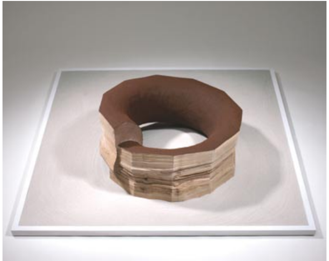
Verformung Teil 2 D 53 cm x 30 cm Holz, Eisenspäne, Sand 2010