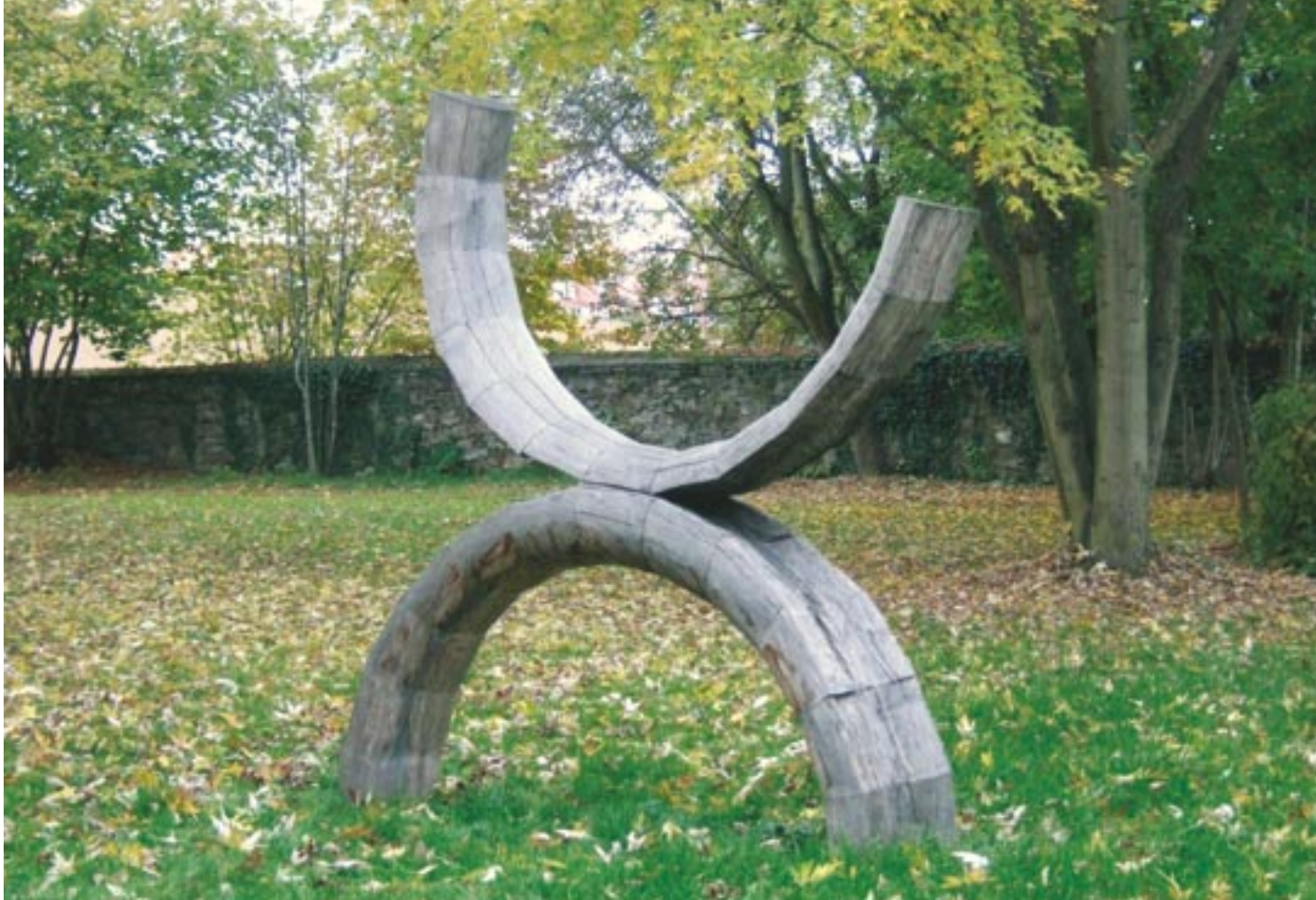
zur Erde – zum Himmel 180 cm x 190 cm x 35 cm Holz 2006 Schmerlenbach, Tagungszentrum des Bistums Würzburg