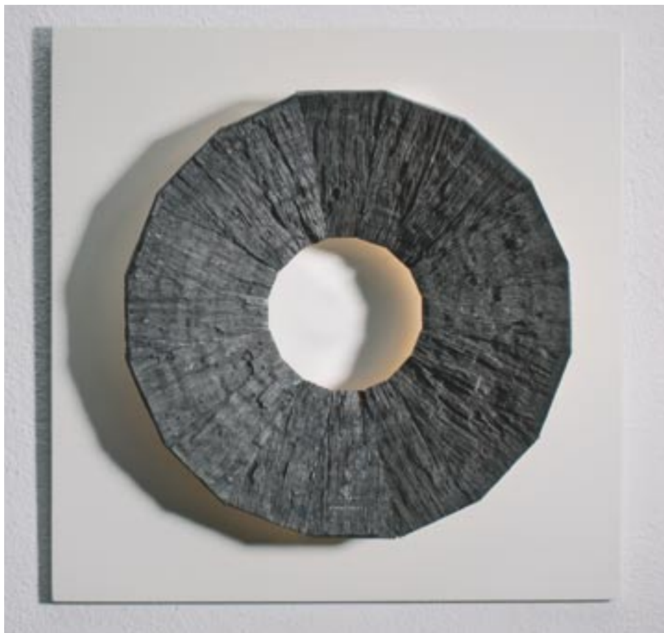
Tag 40 cm x 40 cm Mooreiche, Schlagmetall, Lack 2010