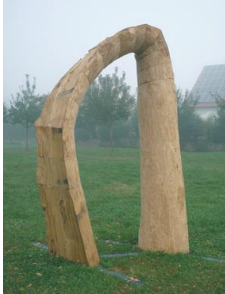
Öffnung 240 cm x 140 cm x 70 cm Holz 2009